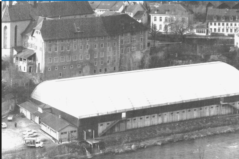
Site de Saint-Léonard 1982 - 2010 BCF-Arena 2010-2020