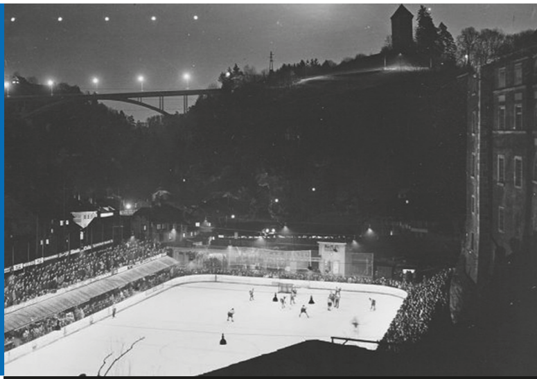
Patinoire des Augustins après rénovation 1941 - 1982