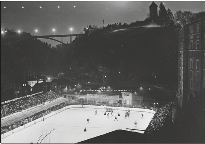
Patinoire des Augustins après rénovation 1941 - 1982