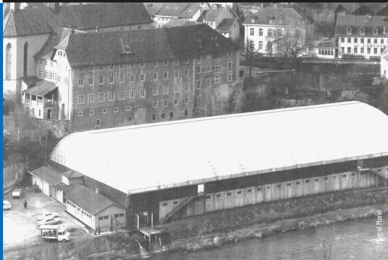
Site de Saint-Léonard 1982 - 2010 BCF-Arena 2010-2020